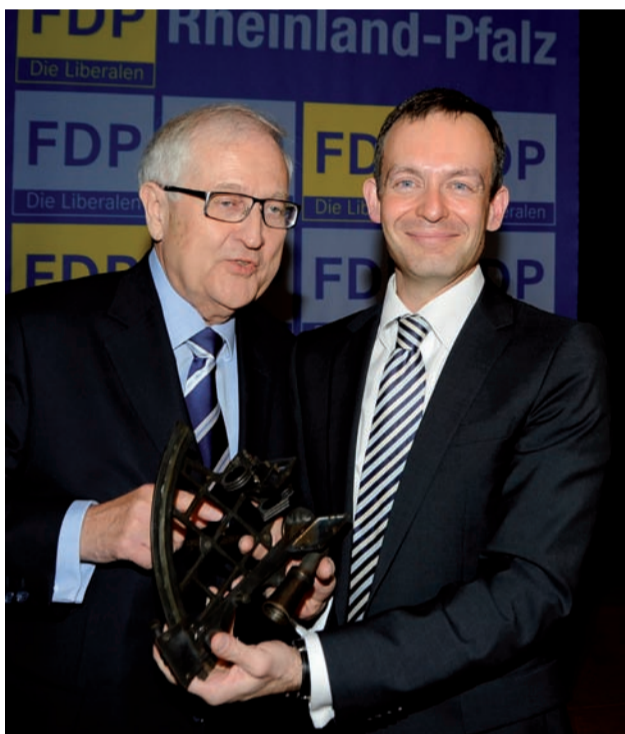
Vom scheidenden Landesvorsitzenden gab's einen Sextanten. „...für eine allseits exakte liberale Standortbestimmung...“

Nach dem Ausscheiden aus dem rheinland-pfälzischen Landtag bei der Landtagswahl am 27. März hatte der am 12. März 2011 neu gewählte Landesvorstand seine Ämter zur Verfügung gestellt.